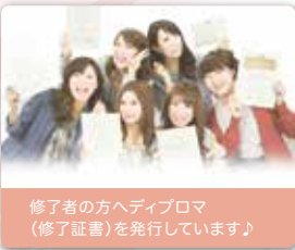
修了者の方へディプロマ(修了証書)を発行しています!