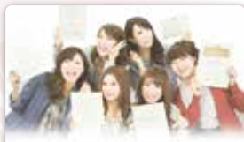
修了者の方へディプロマ(修了証書)を発行しています♪